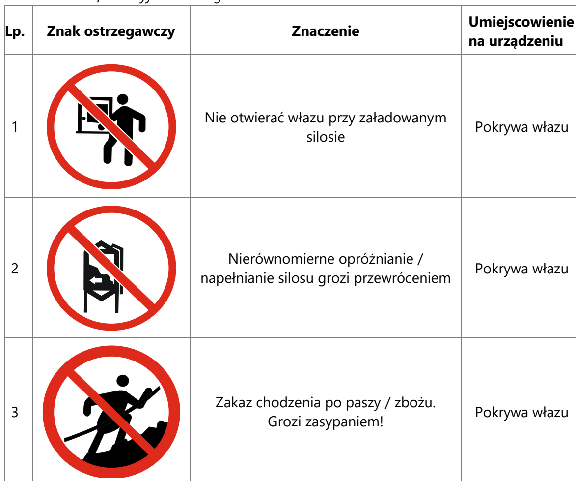
Tab. 1 Znaki informacyjne i ostrzegawcze na silosie AGOS

Należy bezwzględnie zapoznać się z umieszczonymi znakami informacyjnymi i ostrzegawczymi na silosie: